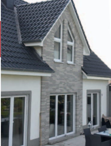
Dank fundierter Handwerkskunst und verantwortungsvoller Bauausführung entstehen attraktive und individuelle Häuser.