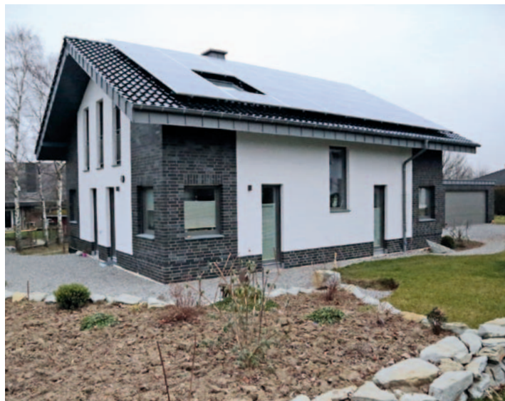
Individuell geplante Architektenhäuser werden vom Lippstädter Bauunternehmen Falkenstein realisiert.

Paare möchten ihre Kinder am liebsten im eigenen Haus groß ziehen, andere wollen ihrer Mietwohnung den Rücken kehren und sind auf der Suche nach einer modernen Eigentumswohnung. Um diese Wünsche zu realisieren, sucht man sich einen kompetenten Fachmann, der das notwendige Know How besitzt. Das Bauunternehmen Falkenstein aus Lippstadt ist ein solch kompetenter Partner, der für seine Kunden ein umfangreiches Servicepaket schnürt. Intensive Beratung, individuelle Planung, solide Ausführung und eine zuverlässige Glaubwürdigkeit bescheren dem Unternehmen dauerhaft zufriedene Bauherren und glückliche Hausbesitzer.