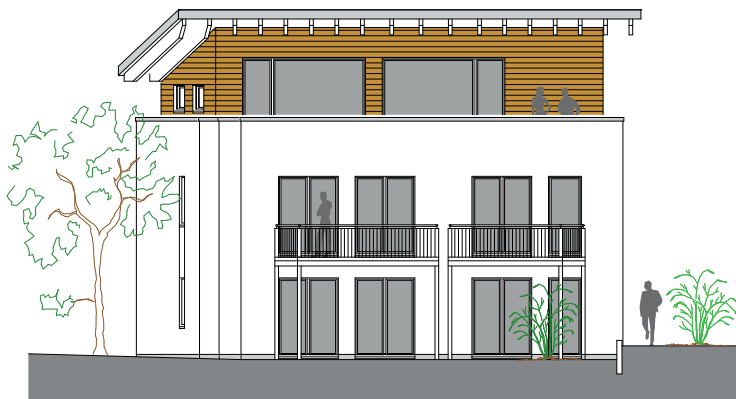
Aktuelles Projekt: der Neubau eines Mehrfamilienhauses in Rütthen (siehe Skizzen); zwei Eigentumswohnungen stehen momentan noch zum Verkauf.

„Wir realisieren individuelle Architektenhäuser und realisieren Bauprojekte nach den Wünschen der Bauherren und nach den örtlichen Bauvorschriften. Wir stehen mit unserem Namen für fundierte Handwerkskunst und eine verantwortungsvolle Bauausführung“, unterstreichen die beiden Geschäftsführer die Philosophie ihres Unternehmens, das neben den Tätigkeiten beim Hausbau mit diversen Auftragsarbeiten im Tief- und Hochbau und im Bereich der Sanierung sein Leistungsspektrum komplettiert. Unterstützt